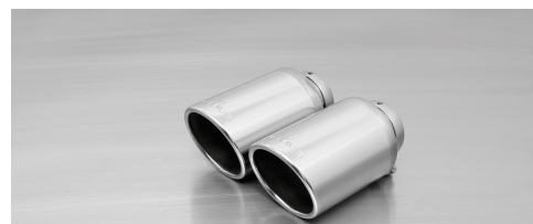
#70SS: Endrohre Ø 102 mm schräg/schräg, verchromt