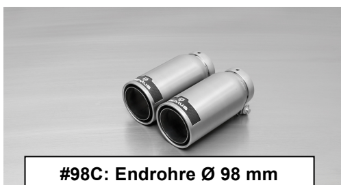
#98C: Endrohre Ø 98 mm Street Race, poliert