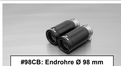
#98CB: Endrohre Ø 98 mm Street Race Black Chrome