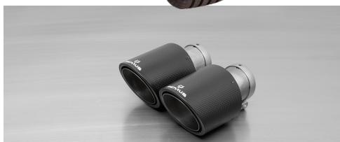
#70CSS: Carbon-Endrohre Ø 102 mm schräg/schräg, Innenaufbau Titan